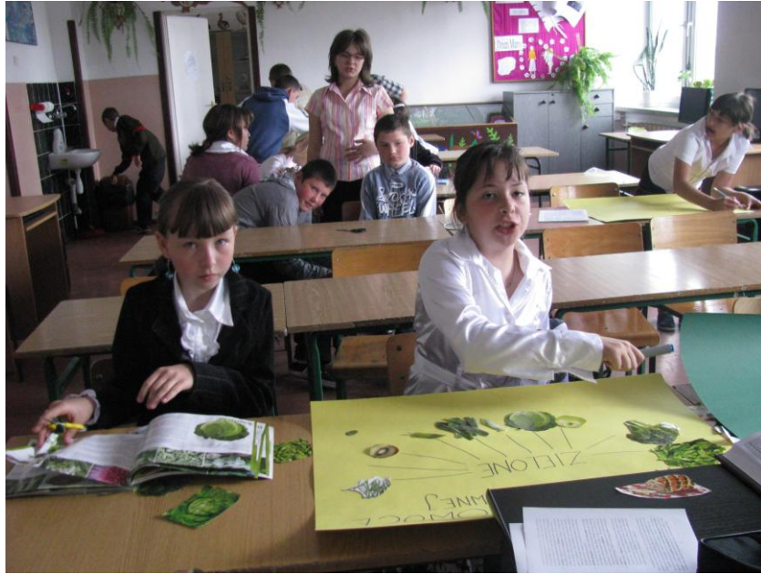
Klasa v c podczas wykonywania plakatów