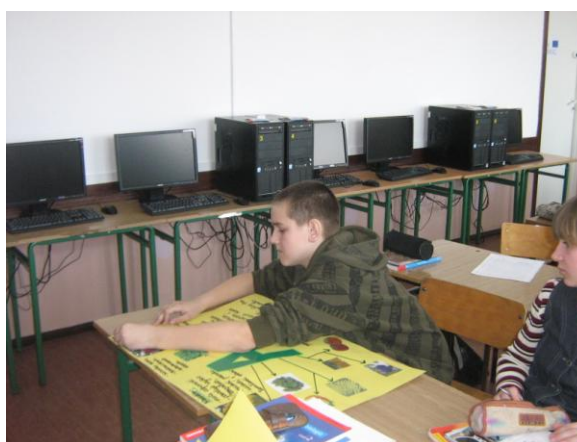
Klasa I gimnazjum podczas wykonywania plakatów