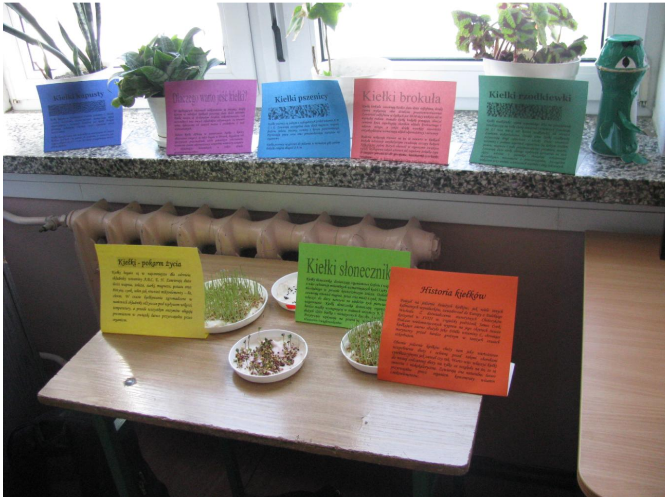
Hodowla kiełków wraz opisami ich właściwości odżywczych